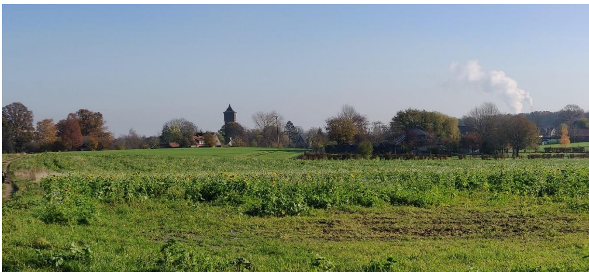
Blick auf Cappenberg