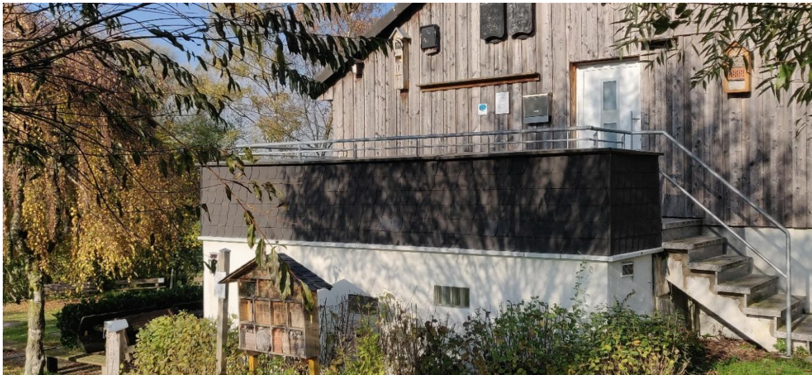
Wanderhütte Netteberge des SGV