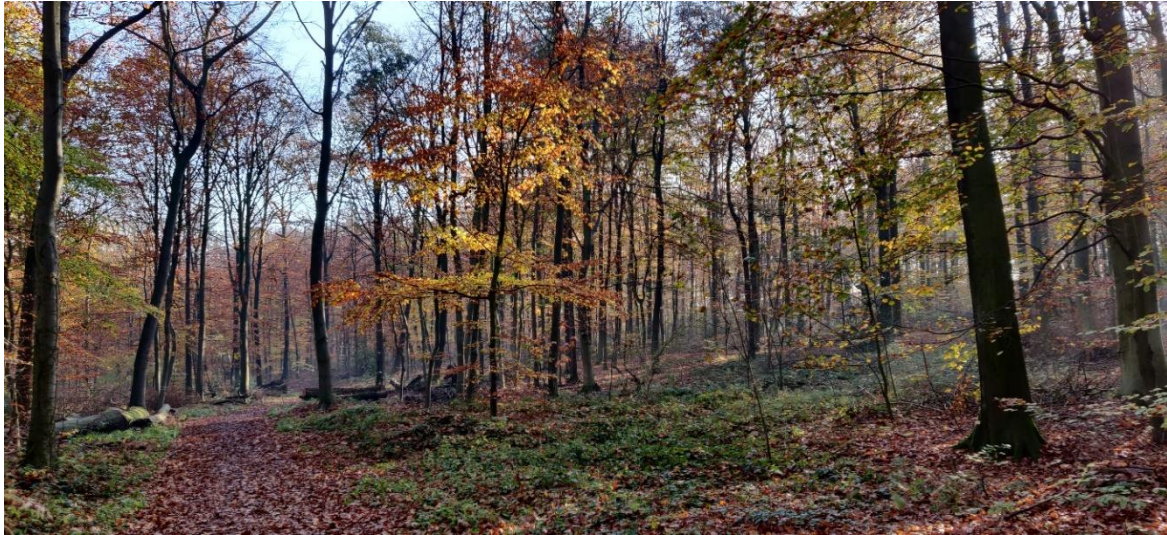
Im Cappenberger Forst