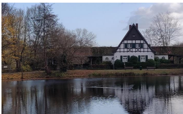
Forsthaus, Gelsenkirchen Stadtwald