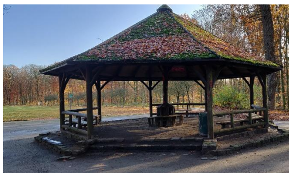
Pavillon, Gelsenkirchen Stadtwald