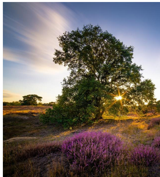
Blütezeit in der Heide

Wir starten am Parkplatz des Lake Side Inn laufen ein Stück an der romantischen Stever (liegt links von uns) entlang bis zum Bootsverleih. wo wir rechts in den Aalweg abbiegen und über die Hullerner Straße zur Westruper Heide wandern. Wir genießen die blühende Heide und kommen schließlich am Hotel Seehof aus. Von dort aus wandern wir um den Halterner Stausee.