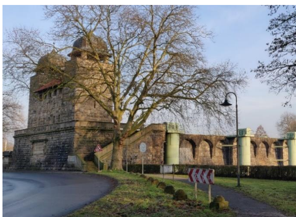
Alte Schleuse Henrichenburg