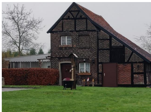
Wohnhaus, Am Felling