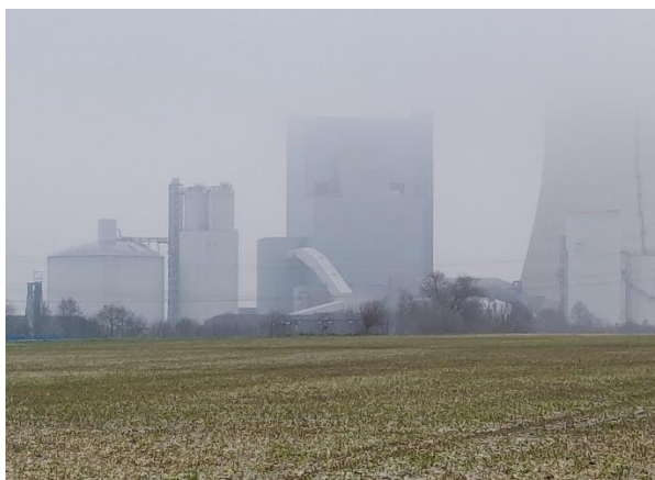
Kraftwerk, Datteln 4