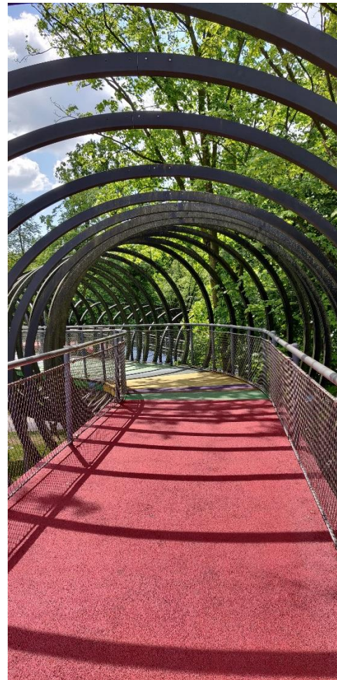
Spiral Brücke Slinky am Kaisergarten