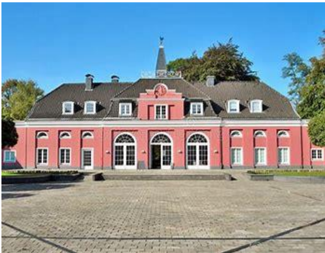
Schloss Oberhausen, Ludwig Galerie