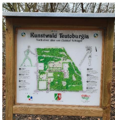
Übersicht Kunstwald Teutoburgia

Achtung, festes Schuhwerk anziehen, einige Wege sind sehr schlammig!