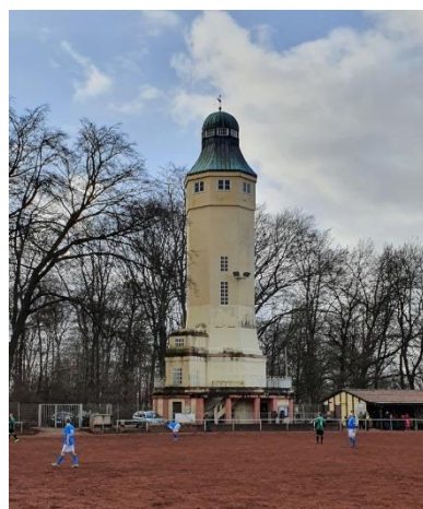
Sportplatz am Kaiser-Wilhelm Turm