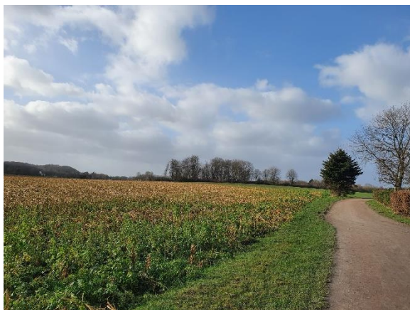
Durch Feld, Wald und Wiesen