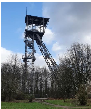
Im Kunstwald Teutoburgia