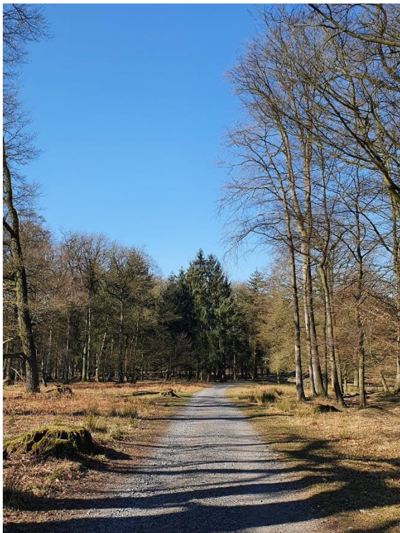
Durch Wälder und Wiesen