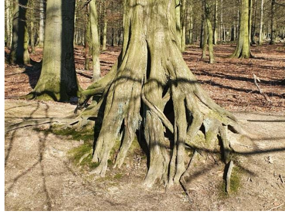
Nicht nur Rotwild, sondern auch gesunde alte Bäume zieren den Weg