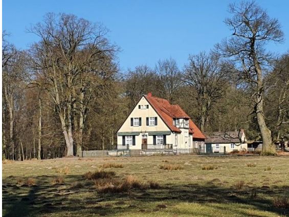
Im Wildpark vor der Verwaltung des Herzogs von Croy