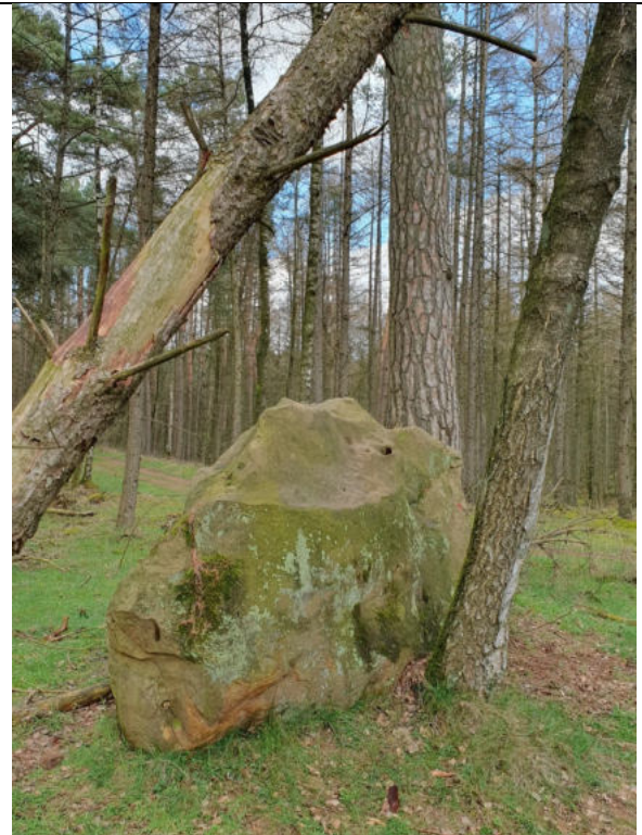
Findlinge säumen den Weg