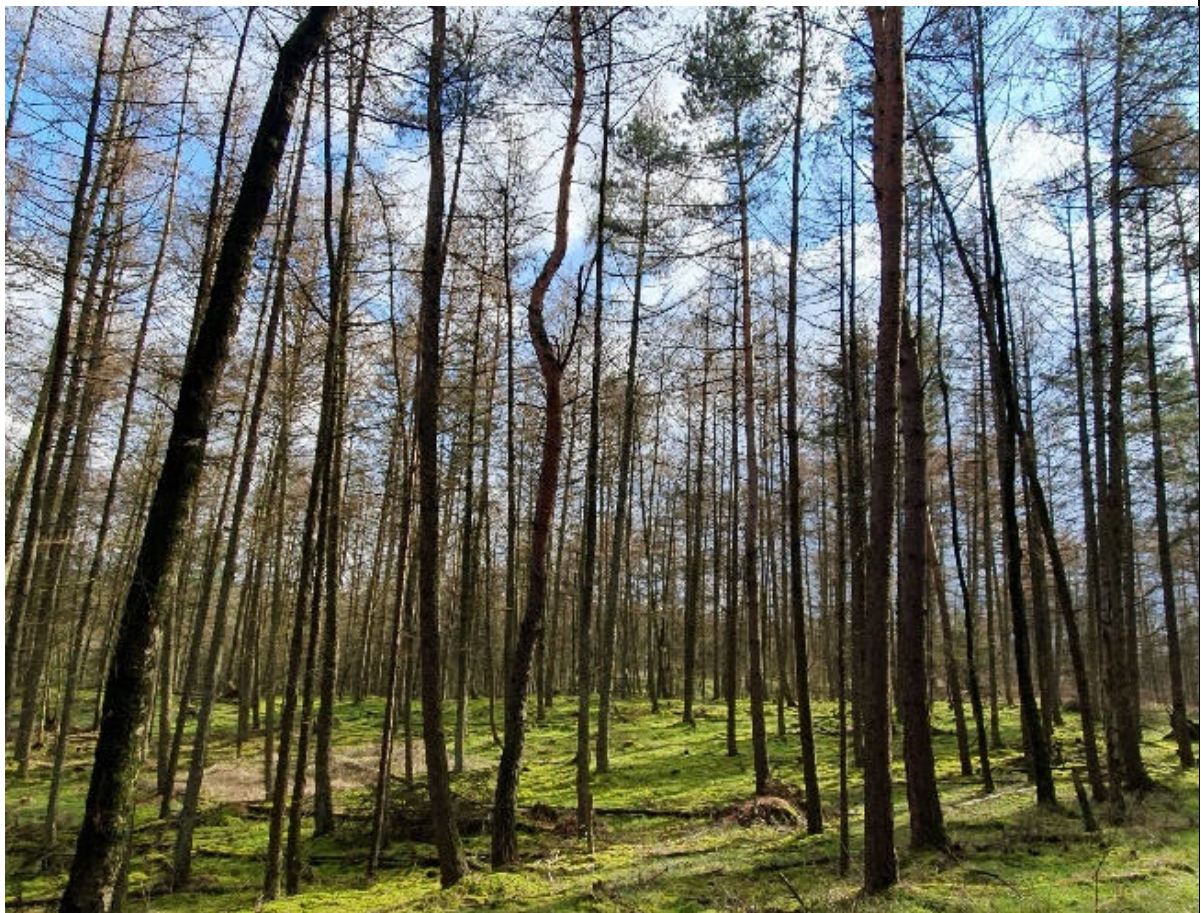
Und herrliche Wälder und Moore erwarten uns