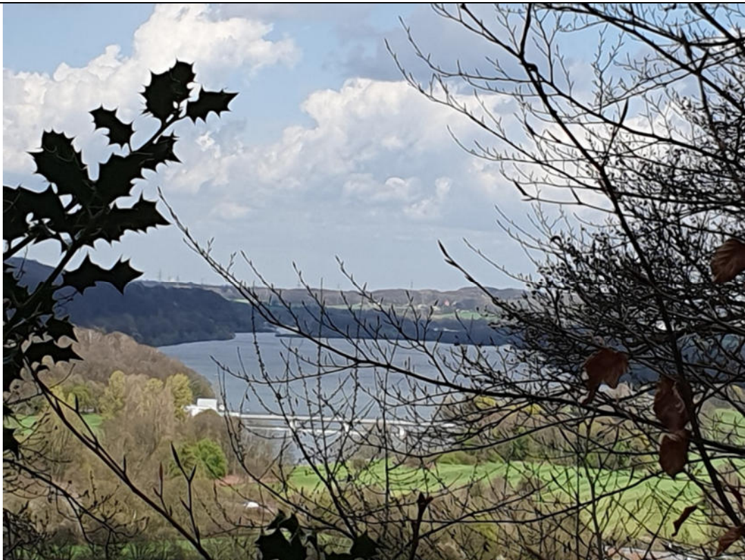
Hoch über dem Ruhrtal