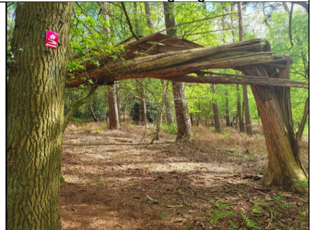
Blick auf ungewöhnliche Baumbrüche