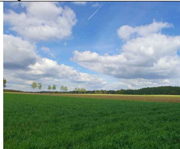
Vorbei an Feldern und zwischendurch