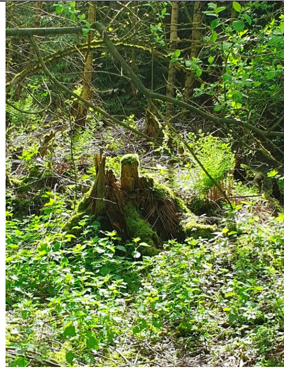
mit mystischen Lichtspiegelungen