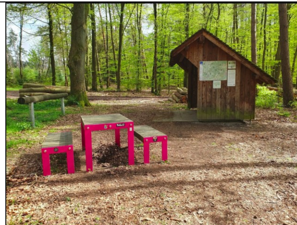
Dieser Platz lädt zu einer Rast ein.