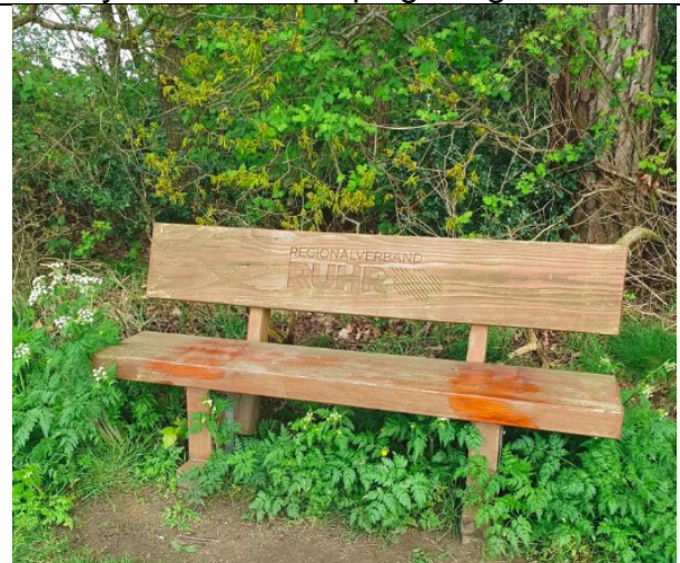
immer wieder eine Sitzgelegenheit